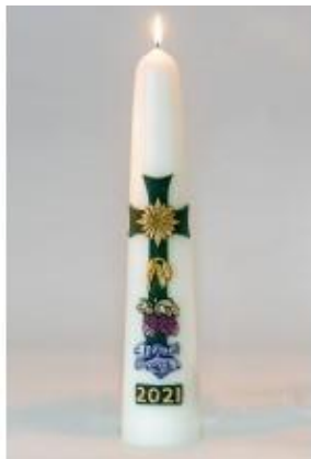
Vissen en Druiven