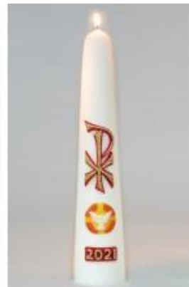
Christusmonogram met vredesduif